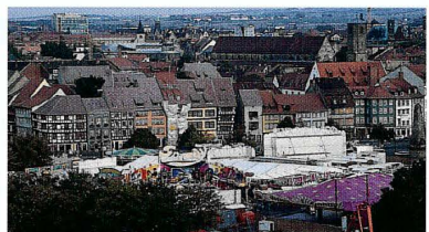
歴史的建築物が凝縮した街

緑の多い街なので散策もまた楽しい。この街にはなぜかイタリアン・ジェラートの店が多い。安いのでぜひお試しを。また、やたらと目に付くのが教会。かつて市街にはなんと36もの教会や礼拝堂、15の修道院があったそう。ついたあだ名が「塔の国」。エアフルトの人は信心深いようだ。