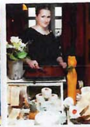
Goldhelm Schoko- ladenmanufaktur