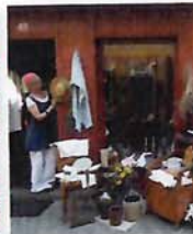
Antiquitäten Johanna Pause