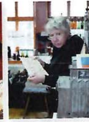
Kunst und Krepel